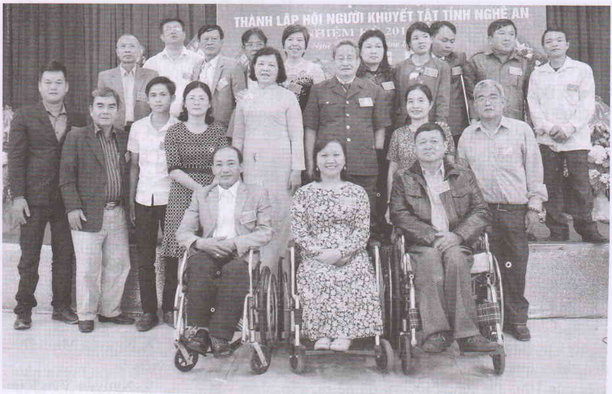
Các đại biểu chụp ảnh Lưu niệm tại Đại hội

+ Quan tâm động viên con em của người khuyết tật không ngừng phấn đấu rèn luyện học tập, có phẩm chất đạo đức, hiếu nghĩa, biết thương yêu cha mẹ và có trách nhiệm với cuộc sống gia đình để chăm lo giúp đỡ thân nhân là người khuyết tật.