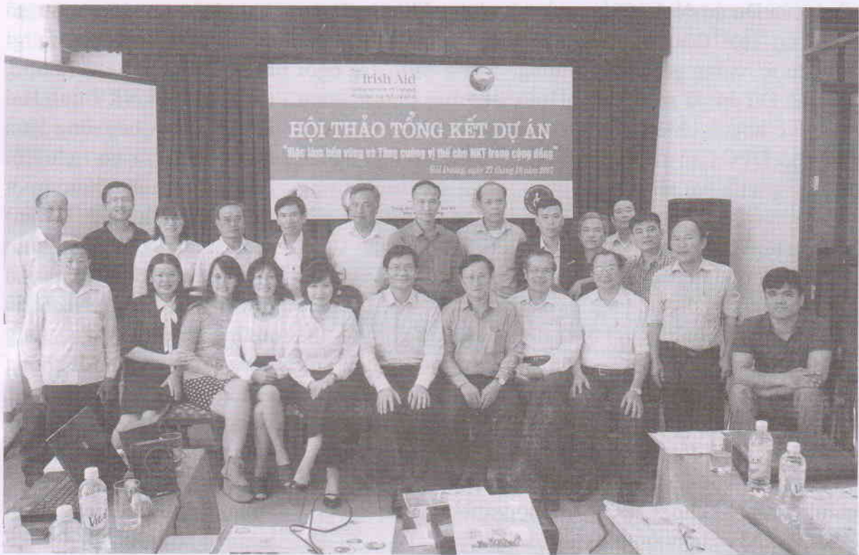
Các đại biểu tham dự Hội thảo Tổng kết chụp ảnh lưu niệm

kiến thức và kỹ năng về ghi chép và quản lý tiền, tài sản cho nhóm sản xuất- kinh doanh tự quản của NKT; Thiếu một hệ thống theo dõi NKT sau học nghề. Từ đó đưa ra một số bài học kinh nghiệm, :