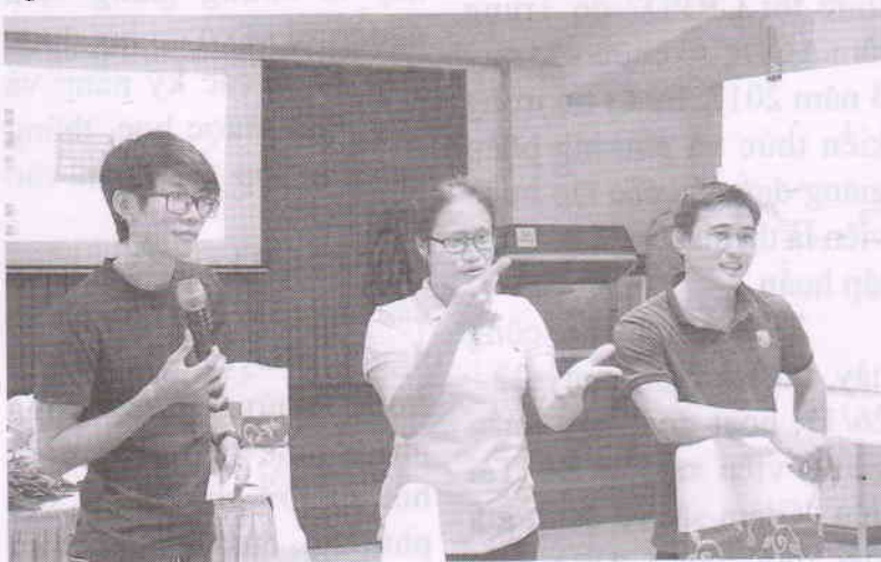
Một số hoạt động tại buổi tập huấn

Tại Vũng Tàu, ngày 07 - 08/11, khóa tập huấn “Luật Người khuyết tật và các chính sách liên quan” đã diễn ra với sự tham gia của 35 người khuyết tật trên địa