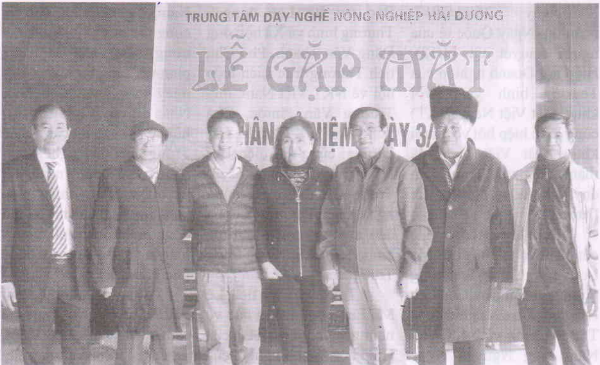
Đoàn chụp ảnh lưu niệm cùng lãnh đạo Trung tâm dạy nghề NN Hải Dương