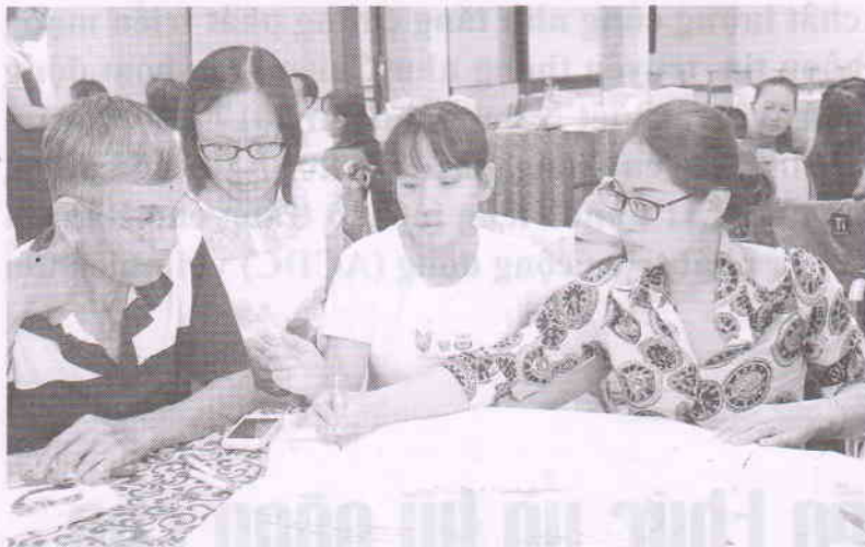
Một số hoạt động tại buổi tập huấn

bàn. Đây là khóa tập huấn lại đầu tiên trong chuỗi tập huấn lại Bộ Tài liệu ở khu vực miền Nam