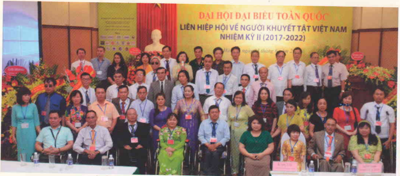
Ban Chấp hành Khóa II Liên hiệp hội về người khuyết tật Việt Nam

* VFD ưu tiên thực hiện chương trình hành động của mình vào việc hỗ trợ người khuyết tật, bảo vệ quyền, lợi ích của người khuyết tật và góp phần nâng cao nhận thức xã hội, đưa Luật Người khuyết tật (năm 2010) và Công ước quốc tế về quyền của người khuyết tật đi vào cuộc sống một cách sinh động và hiệu quả.