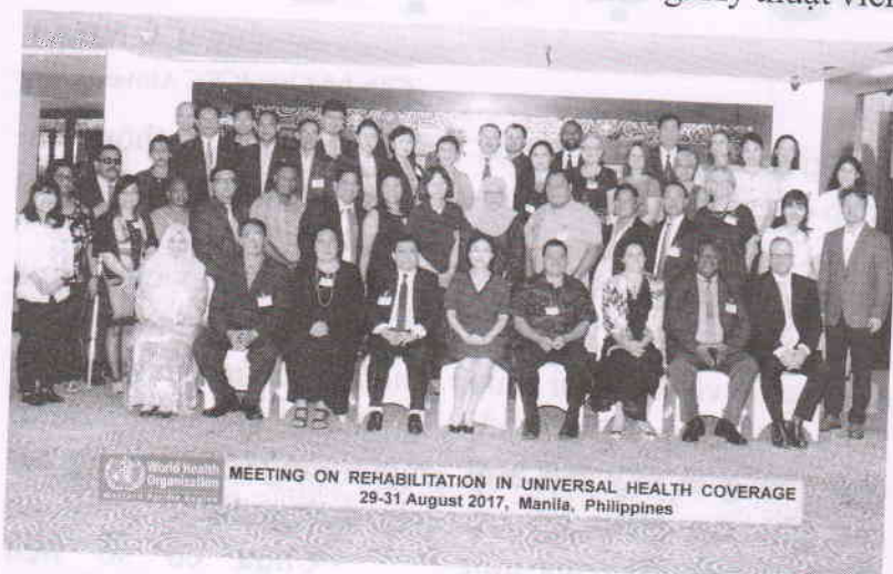
Cán bộ Bộ Y tế Việt Nam tham gia cuộc họp Khu vực về Phục hồi chức năng trong Bảo hiểm toàn dân tại Manila, Phillipines tháng 08/2017.

WHO còn khuyến cáo các dụng cụ trợ giúp phải phù hợp với người sử dụng và môi trường của người sử dụng. Ví dụ, người sử dụng sống ở vùng nông thôn với địa hình gồ gề có thể cần xe lăn có hệ thống kéo và chống trượt hơn là người sử dụng sinh sống ở thành thị