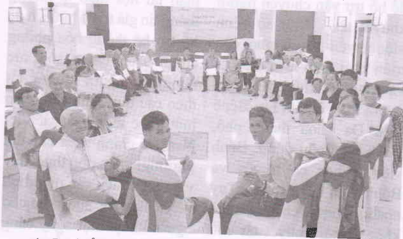
các Đại biểu tham dự được cấp chứng chỉ sau buổi tập huấn

Dự kiến trong thời gian tới, Trung tâm ACDC sẽ tiếp tục triển khai các khóa tập huấn và hoạt động trên địa bàn để hỗ trợ phát triển năng lực cho các cán bộ nông cốt của hội, nhóm người khuyết tật tại địa phương.