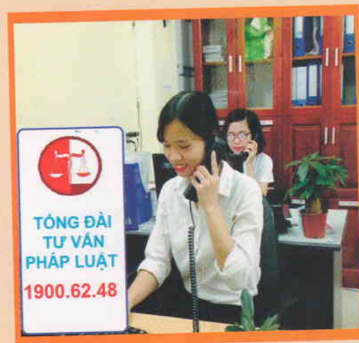
Tổng đài tư vấn pháp luật 24/7