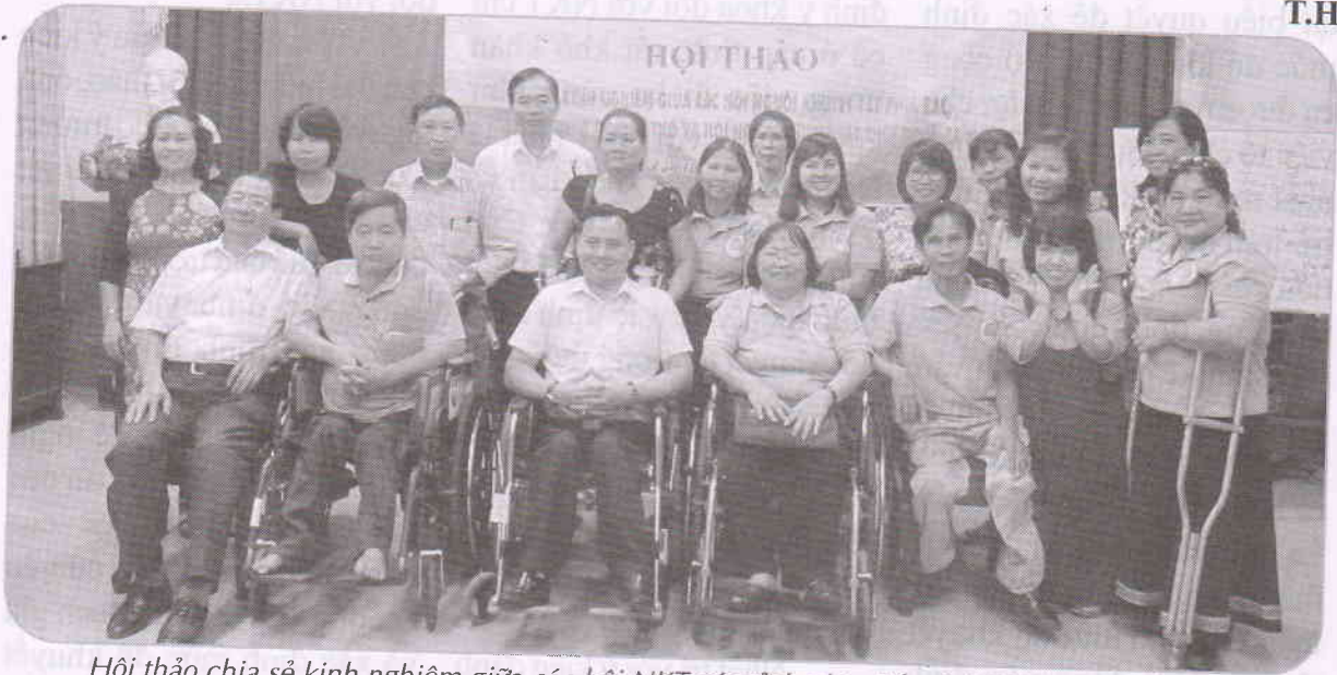
Hội thảo chia sẻ kinh nghiệm giữa các hội NKT các tỉnh phía Bắc và Hội NKT TP. Cần Thơ