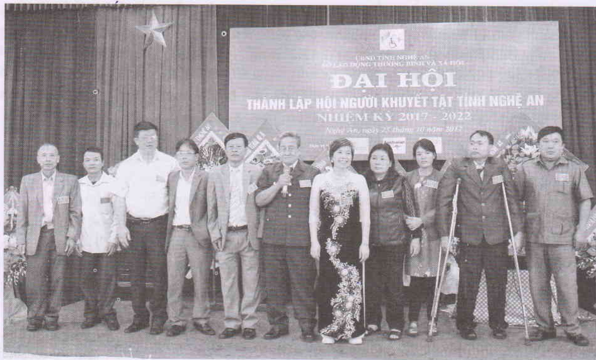
Ban Chấp hành Hội Người khuyết tật tỉnh Nghệ An

+ Liên hệ với các cơ quan thông tấn báo chí, phát thanh, truyền hình trung ương và địa phương tích cực tuyên truyền mọi mặt hoạt động của Hội, đặc biệt là những trường hợp có tinh thần vượt khó vươn lên, chiến thắng với bệnh tật để có cuộc sống vật chất tinh thần ổn định hòa nhập với cộng đồng xã hội, có lối sống khiêm tốn, lành mạnh và tinh thần học tập ngày càng tiến bộ được cán bộ, hội viên khâm phục quý mến.